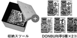
収納ツール DONBURI亭5種×2コ