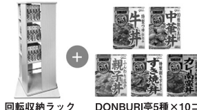
回転収納ラック DONBURI亭5種×10コ