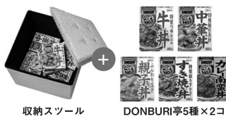
収納ツール DONBURI亭5種×2コ