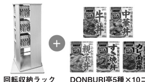
回転収納ラック DONBURI亭5種×10コ